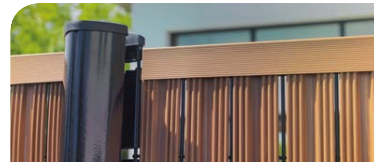
Lisse de finition haute