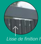
Lisse de finition haute

5 Fixer la lisse de finition en haut du panneau face plane côté pli du panneau pour verrouiller les lattes.