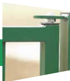
Gond du portail