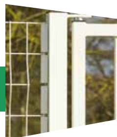
Départ clôture (option)